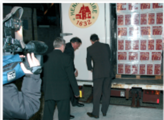
A l'arrivée du camion, on ôte les scellés.