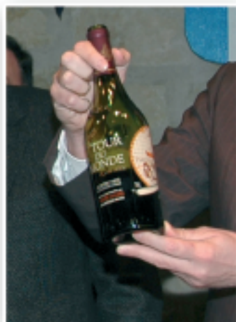
Le précieux flacon bourlingueur.