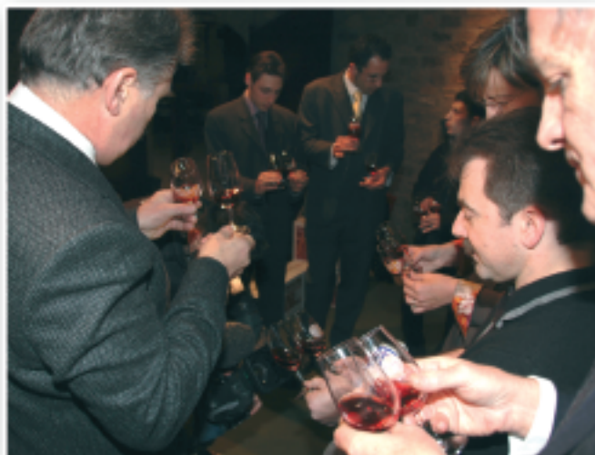
Comparaison de la robe des deux vins

Et mi février 2007 l'Arbois Tour du Monde est revenu en terre natale.